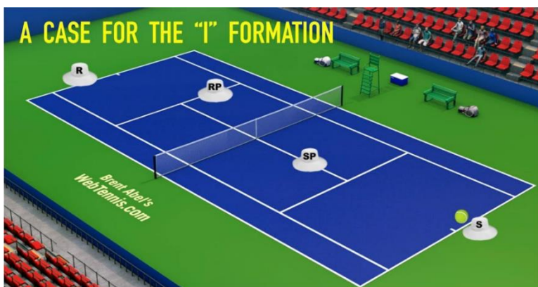
Slika 5: I-raspored dubla koji je na servisu

Drugi termin odnosi se na mesto u obliku slova T na teniskom terenu, sa obe strane mreže, na kojem se pod pravim uglom spajaju servis-linija i kraj središnje servis-linije (Slika 6).