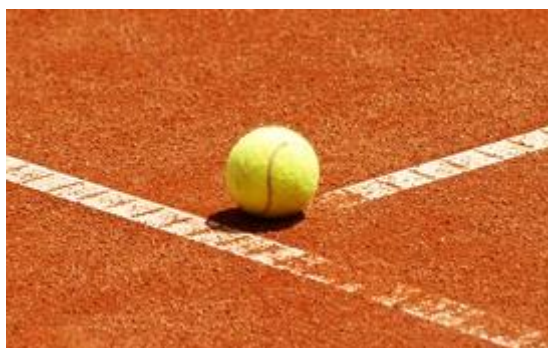
Slika 6: T-linija na teniskom terenu

Drugi termin odnosi se na mesto u obliku slova T na teniskom terenu, sa obe strane mreže, na kojem se pod pravim uglom spajaju servis-linija i kraj središnje servis-linije (Slika 6).