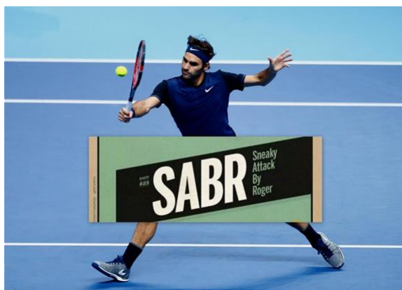
Slika 1: SABR – sneak attack by Roger : napad riternera započet kretanjem prema mreži i pre nego što loptica padne u servis-polje, s ciljem da se protivnik iznenadi brzim udarcem