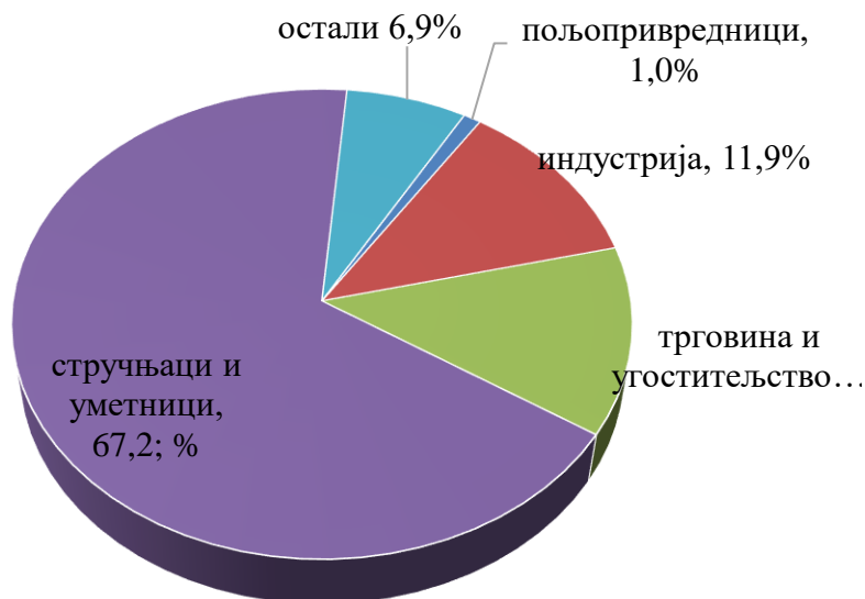
Графикон 2. Досељено активно становништво, 2020.